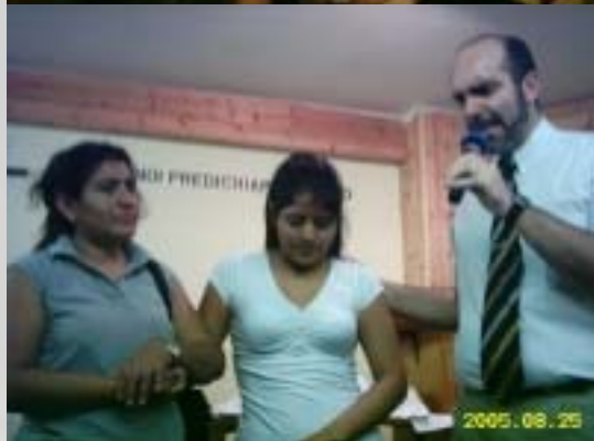
Un momento di preghiera e intercessione