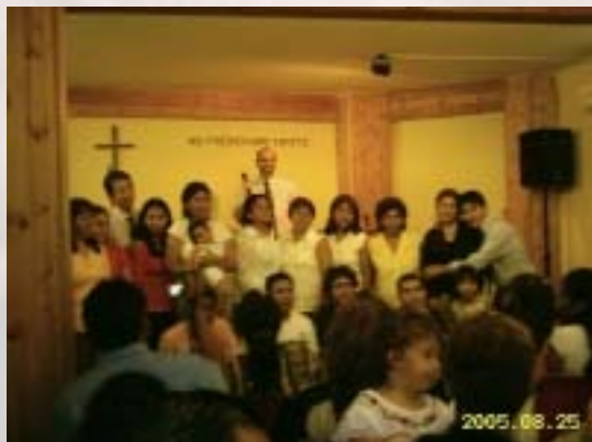
Parte della Chiesa di Genova gruppo Latino-Americano